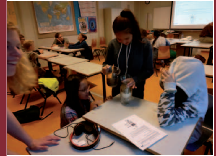
Met een fles, zand, watten en steentjes kun je zelf een waterzuivering bouwen.