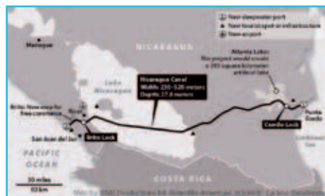
De route van het nieuwe kanaal met de bijbehorende andere projecten.

Terwijl het nieuwe Panamakanaal schepen tot 150 TEU aan kan (Twenty Feet Equivalent Unit; de rekeneenheid voor de inhoud van containerschepen), moet het Nicaraguakanaal schepen tot 250 TEU aan kunnen. De kosten van aanleg bedragen 50 miljard dollar, hetgeen ongeveer het vijfvoudige is van het bnp van Nicaragua. In lijn met de eerdere projecten staat het kanaal niet op zich, maar wordt het gekoppeld aan andere megaprojecten zoals de aanleg van twee diepzeehavens aan weerszijden, een oliepijplijn, meer dan 5.600 km. nieuwe wegen, spoorverbindingen, twee bruggen (om het nu 'doorsneden' Nicaragua weer met elkaar te verbinden), een nieuwe internationale luchthaven, een vrijhandelszone en voorzieningen voor grootschalig toerisme. Kortom, een super ambitieus project waarmee zowel de Nicaraguanse regering als de Chinese zakenman Wang Jing voortvarend aan de slag gingen.