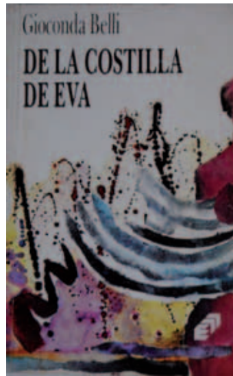
Boekomslag: De la costilla de Eva.