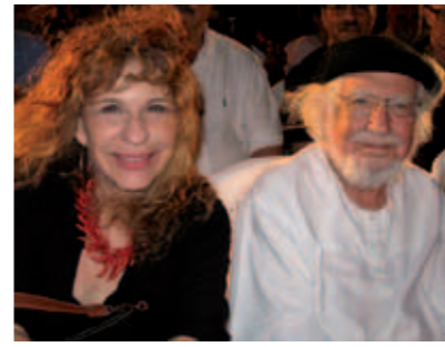
Gioconda Belli en Ernesto Cardenal.