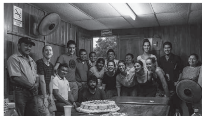
Het team van ASODELCO met de Groningse en Baskische studenten.

In de eerste week bezochten we een klein dorpje genaamd Melchorita. Een gemeenschap dat nog geen geïnstalleerde waterleidingen heeft. Geen stromend water! Hoe kun je daar mee leven? Dit soort dingen opent je ogen en laat zien hoe goed wij het in Europa hebben. In Melchorita hebben we vrouwen die een klein boerenbedrijf hebben, opgezet met behulp van het Emprende Mujer programma, geïnterviewd, zoals bijvoorbeeld de eigenaresse van een bedrijfje die maïs, bonen en rijst verbouwt (de voedingsmiddelen die veel gegeten worden in Nicaragua).