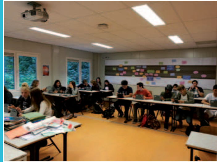
Na de algemene introductie werkt elke klas met de eigen docent aan een opdracht.