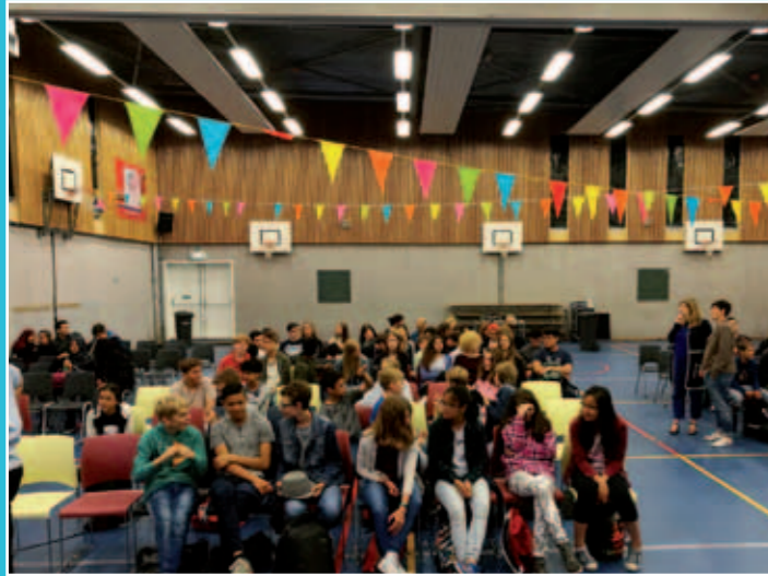
De algemene introductie is voor alle klassen tegelijk in de gymzaal van de school.