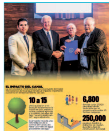
Presentatie van de studie over de sociale impact en de milieu impact van het kanaal.

Terwijl de regering, gesteund door veel Nicaraguanen in de stedelijke gebieden de uitkomst van het eerder genoemde ERM-rapport toejuichen en als aanmoediging zien om over te gaan tot aanleg, zien veel anderen, en met name in de plattelandsgebieden, toch vooral de nadelen zoals die door het Centro Humboldt verwoord werden. Ondertussen wijst de HKND erop dat de meeste nadelen waarvan dat rapport spreekt juist ondervangen worden. Zo wordt de bestaande en dreigende ontbossing van grote delen van Nicaragua (door verbranding en houtkap door lokale boeren) tegengegaan door grootscheepse herbebossing rond het nieuwe kanaal. En zo wordt de huidige, verslechterende waterkwaliteit van het Nicaraguameer tegengegaan door die herbebossing en door andere milieumaatregelen. Verder moeten weliswaar bijna 7.000 gezinnen wijken voor het water, maar daar zijn slechts 25 inheemse families bij, terwijl aan de ander kant het hele project werk oplevert voor maar liefst 250.000 bewoners via (in)directe banen, zo zegt de regering.