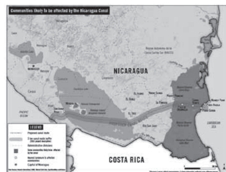
Kaart van de gemeenschappen die door de aanleg van het kanaal getroffen zullen worden.