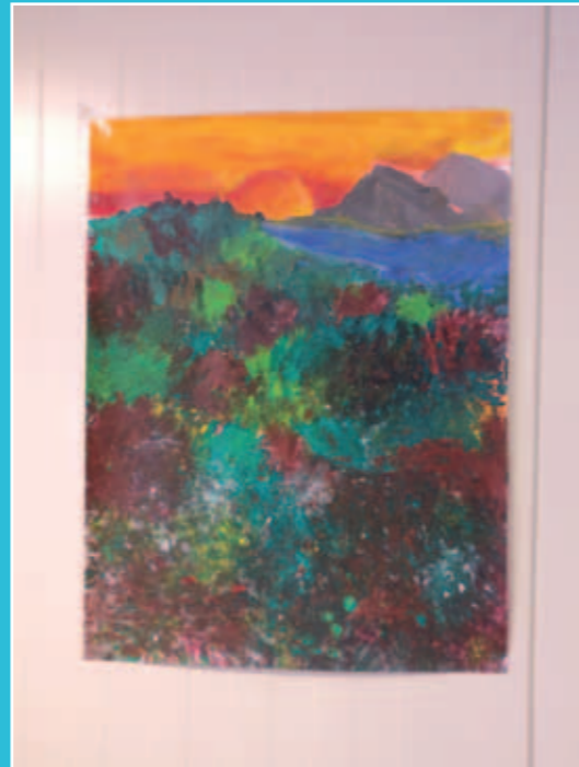
Eén van de schilderwerken die tijdens de eerste lesdag werd gemaakt.