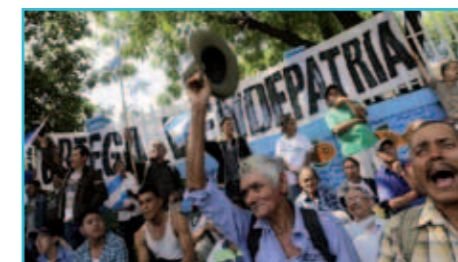
Demonstratie tegen de aanleg van het kanaal.