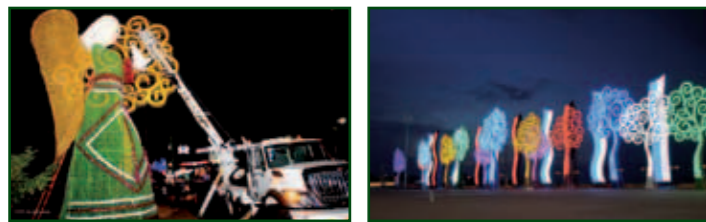
De lichtprojecten van vicepresident Murillo in Managua, bron linkerfoto: El 19 digital, bron rechterfoto: Muriël Duindam.

De discutabele manier waarop de Sandinisten vervolgens in november 2017 (wederom) de gemeentelijke verkiezingen naar hun hand weten te zetten, dragen bij aan het gevoel van onvrede.