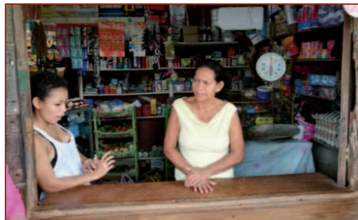
Eén van de vrouwen in Las Azucenas die haar pulperia (winkelje aan huis) heeft uitgebreid met het krediet.

Omdat onze ambities voor dit project onverminderd groot zijn, hebben we dit jaar ook de Donateursactie in het teken van microkrediet gezet. We zijn u allen bij voorbaat dankbaar voor uw bijdrage!