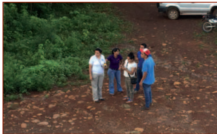
Het team van Asodelco tijdens een werkbezoek aan de vrouwen uit het microkredietproject.

De eerste twee fondsjaren werden uitgevoerd door de Gemeente San Carlos. Sinds 2016 wordt het project uitgevoerd door onze Sancarleense partner ASODELCO, een NGO die actief is op het gebied van duurzame en sociaal-economische ontwikkeling. Zij hebben in totaal drie fondsjaren ontvangen, die in 2016, 2017 en 2018 zijn uitbetaald. Het fonds is revolverend. Dat wil zeggen dat de vrouwen het ontvangen krediet volledig moeten terugbetalen. Dit bedrag vloeit dan weer terug in het fonds. Ze betalen daarnaast een percentage van 8% rente. Op die manier blijft het fonds gevuld en kunnen nieuwe kredieten worden verstrekt. Het afgelopen jaar hebben 69 vrouwen een krediet uit het fonds ontvangen. De bedragen lopen van circa 200 tot ongeveer 400 euro. De looptijd is 1 tot 1,5 jaar. Enkele vrouwen ontvingen een tweede krediet uit het fonds, omdat dit voor de ontwikkeling van hun bedrijfje van belang was. We verwachten dat de bedrijfjes daarna op eigen benen kunnen staan. Van ASODELCO horen we positieve berichten over de ondernemingen die in een eerder jaar een krediet ontvingen uit het fonds en zich nu zelf kunnen bedreuen. We zullen dit ook de komende jaren moeten monitoren om goed te kunnen inschatten wat nu de impact van het krediet is en op welke manier de vrouwen zelfredzaam kunnen zijn, ook als ze geen krediet ontvangen. Die informatie is namelijk belangrijk voor eventuele vervolgplannen van de Stedenband op het gebied van microkredietprogramma's.