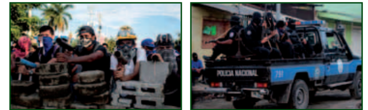
Linkerfoto: Demonstranten bij een wegblokkade met zelfgemaakte mortieren, bron: Times Magazine, foto: Reuters.

van het verzet en er wonen van oudsher veel aanhangers van de Sandinistische partij. Deze keer verzet de wijk zich tegen de Sandinistische leider. De stad ligt hevig onder vuur en vecht terug met zelfgemaakte wapens. Ook op veel andere plekken in Nicaragua houdt het geweld aan, met excessen in onder meer Jinotepe, Matagalpa en Diriamba. De roep van de overheid om de wegblokkades te verwijderen, omdat deze het land economisch volkomen lam leggen, zorgt alleen maar voor meer standvastigheid bij de oppositie: het gaat immers niet om het economische belang van het land, maar om meer democratie en vrijheid. De bevolking eist het opstappen van het presidentiële paar en zal pas dan de blokkades opheffen. De overheid reageert niet op de oproep. De oppositie roept op de wegblokkades die zijn opgeworpen verder te versterken.