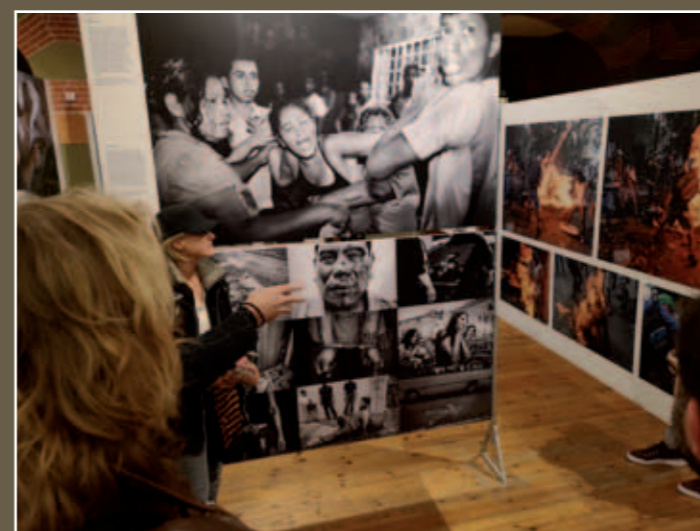
Naar aanleiding van de gruwelijke beelden uit Latijns-Amerika wordt de combinatie van esthetiek en de rol van fotojournalistiek besproken.